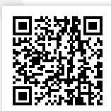
Downloads & Formulare