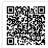
Statuten des Verbandes